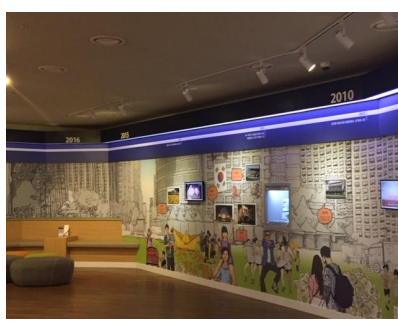
2층 전시 및 체험 연결