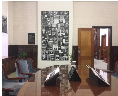
2층 군수실 재현