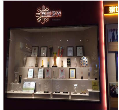
1층 행정박물관 상설전시