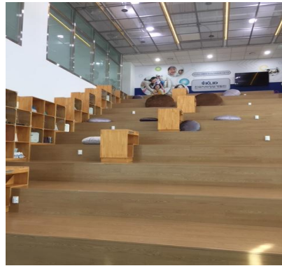
1층 북카페 전시 및 휴식