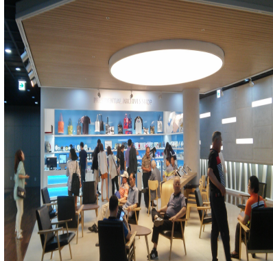
1층 기념물코너 겸 카페