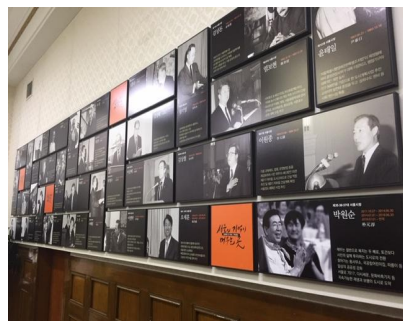
2층 역대 군수 사진 등