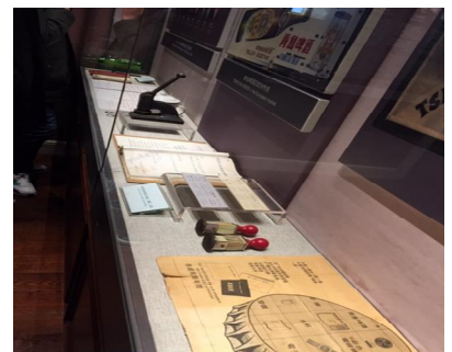
2층 행정기록물 전시