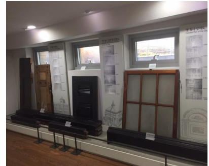
2층 구청사 자재 전시