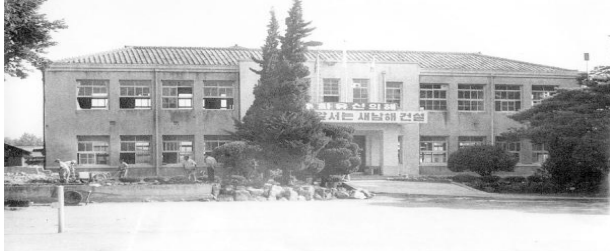
입면도(외형-기존활용 경우에 해당)