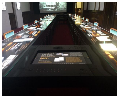
2층 주요변천문서 전시