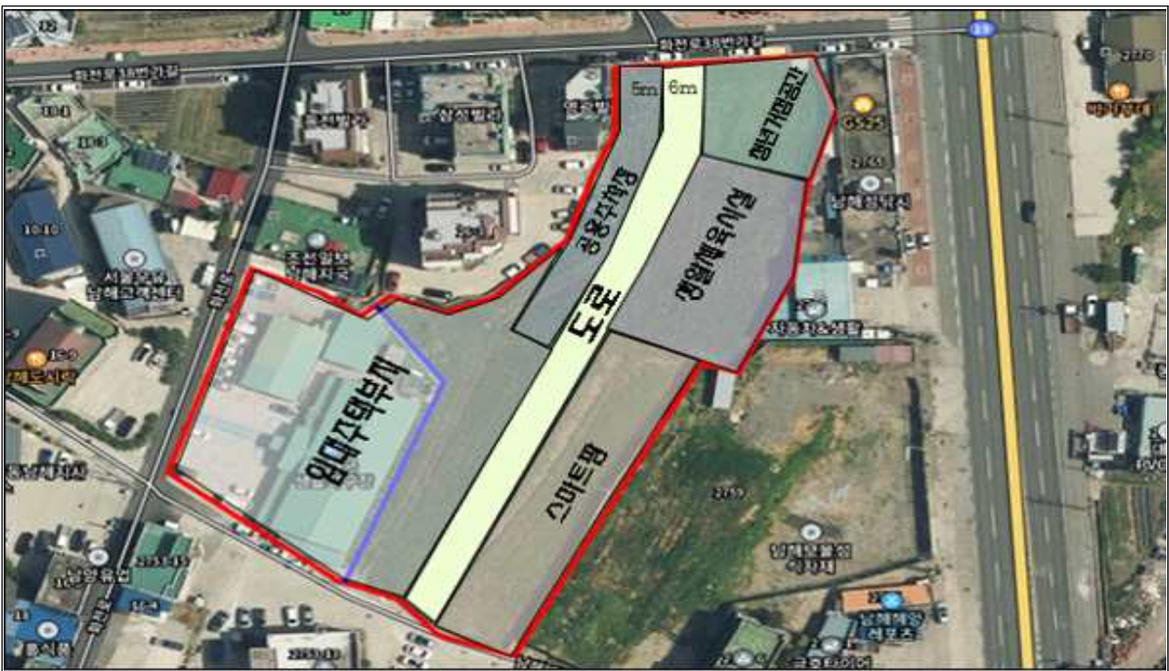
사업 공간 위치도