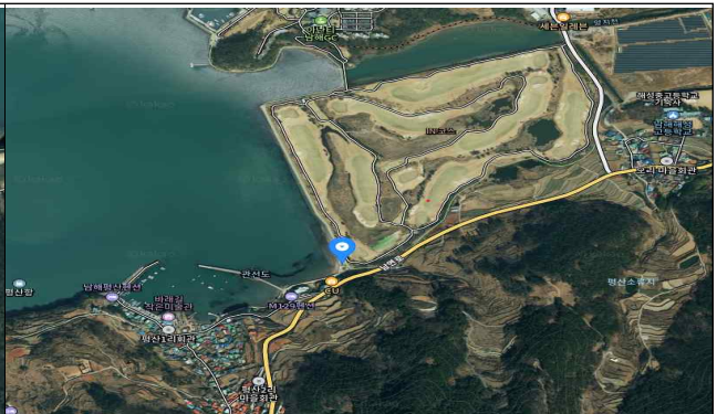
아난티 남해 인근 토양오염도 시료 채취 지점