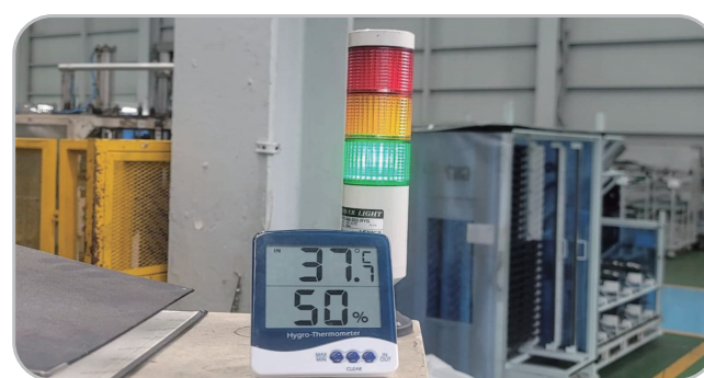
안전 관리 미흡(근로자 등)