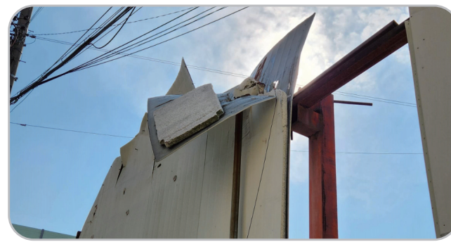
강풍 위험(시설물 낙하)