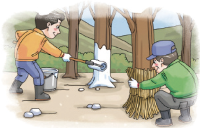
▲ 과수 주간부 벗짚피복 또는 수성페인트 칠하기