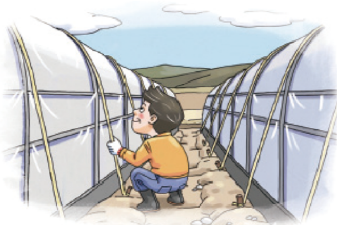
▲ 시설하우스 고정끈 설치 및 보강