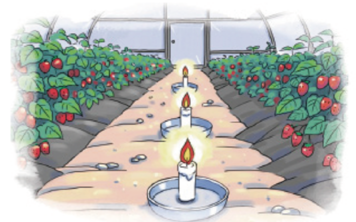
▲ 정전, 온풍기 고장시 양초·알코올 등 응급조치

응급대책 활용시 화재 위험성 및 산소부족으로 불이 꺼질 수 있으므로 세심한 관리 필요