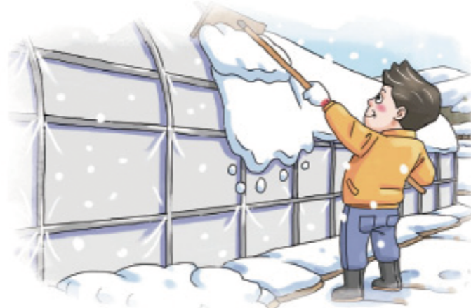
▲ 하우스 위 눈 쓸어 내기