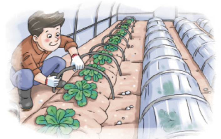
▲ 시설파손, 저온피해 우려시 소형터널 설치