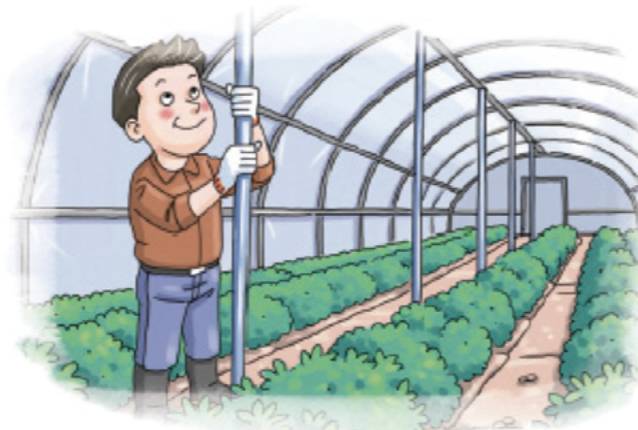
▲ 노후화된 시설 등은 보강지주 설치