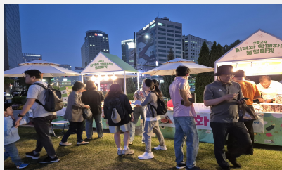
책 읽는 서울광장(야간)