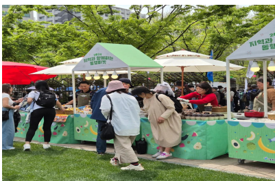
[ 책읽는 서울광장 ]