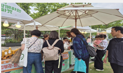
책 읽는 서울광장(주간)