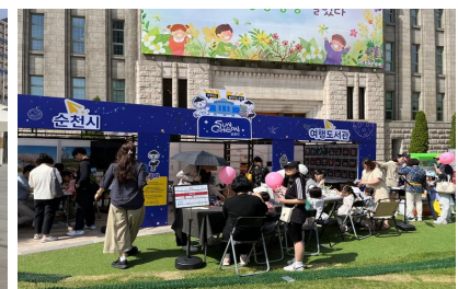
[ 여행도서관 ]